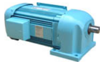
< 製品特性 >